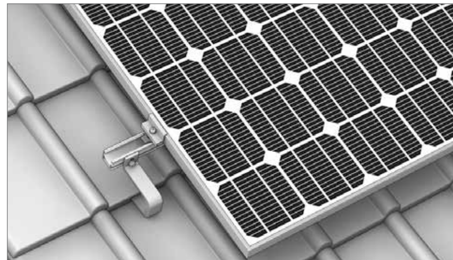
System Abbildung - Montage SingleHook - SingleRail System