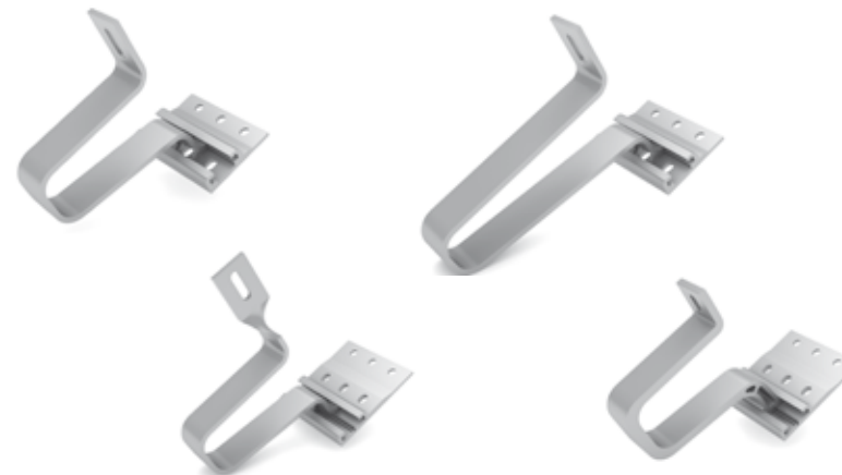
K2 SingleHook 1.4 - Twist Bracket STS